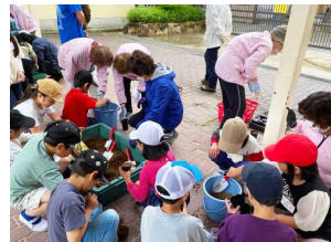
【小学校での種植のようす】