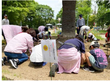
【円形花壇でみんなで一緒に】