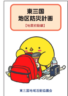
(防災計画書の表紙)